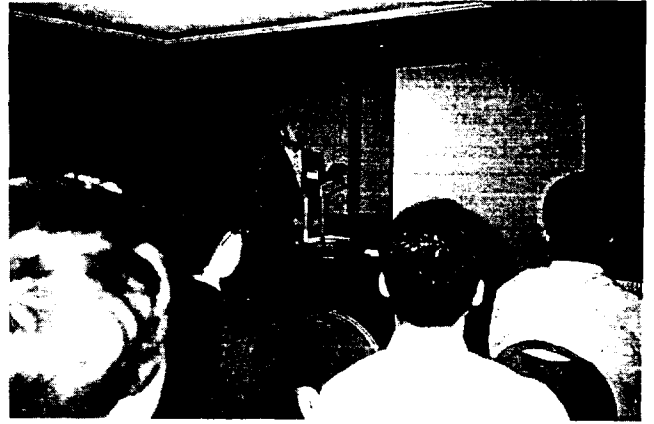
▲ Oral Session장의 발표회 전경

이날 학술발표회에서는 Oral Session 166편, Poster Session 287편 총 453편의 논문이 발표되었으며 Oral Session은 3, 4층 10개 발표회장에서 진행되었고, Poster Session은 2층 사파이