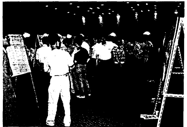
▲ Poster Session장의 발표회 전경

어 볼룸에서 보드판 72개를 배열 설치하여 11개 Session별로 발표논문들을 부착하여 첫날 오전발표, 오후발표, 둘째날 오전발표로 진행되었는바 회의장을 꽉 메운 회원들의 진지한 의견과 토론하는 모습이 우리학회, 나아가 전기계 및 과학기술발전 에 밝은 내일을 여는 광경을 볼 수 있었다.