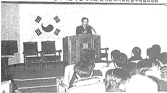
김영성초청 강연회 광경