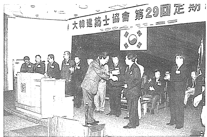
임기가 만료된 각 시도건축사회장 공로패 수여 광경