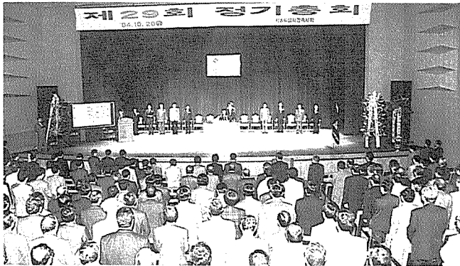
서울 건축사회 총회 광경

본 협회 15개 시·도건축사회의 제29회 정기총회가 지난 10월 20일 제주도건축사회를 필두로 개최되어 95년사업계획 승인 및 예산(안)승인, 신임임원 선