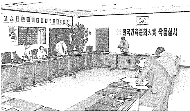
준공건축물부문 1차 심사장경

본 협회는 21세기 신 건축문화 창달을 위하여 서울경제신문사, 건설부와 공동으로 개최한 『94한국건축문화대상』 작품심사 결과를 발표하였다. 총 81개 작품이 출품된 준공건축물 부문에서 영예의 대상은 우원건축(분정일)이 출품한 민정학원이