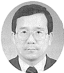
황 선 태

Study of Radon Measurement and Analysis in Indoor Air