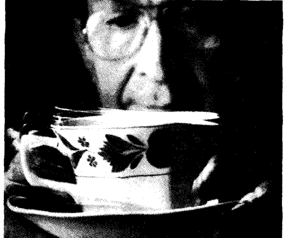
An effective treatment strategy for Parkinson's Disease

In early combination therapy bromocriptine