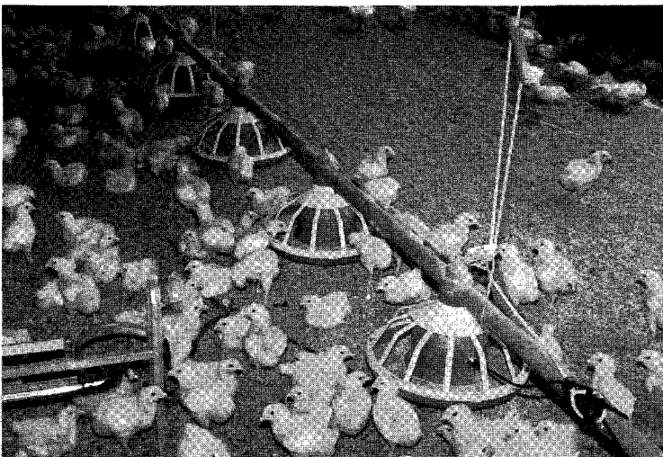
△적절한 약품사용, 효과적인 사료급여는 위생적인 닭고기 생산에 필수

우 리나라 육계산업은 '83년 1인당 1년동안 닭고기 소비량이 3.0kg이던 것이 10년 뒤인 '93년에는 5.8kg으로 거의 2배에 가까운 증가를 보이며 괄목할 만한 성장을 보여오고 있다.