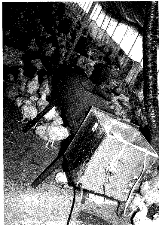
▲ 열풍기 주위에는 인화성 물질을 멀리해야 한다. (간접식 열풍기 모습)

최근 농장에 설치되어 있는 열풍기 사용실태를 알아 개선책을 찾고자 경기도 부근에