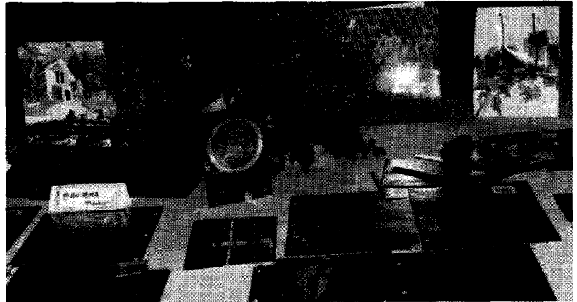
여러 분야에 적용되고 있는 홀로프리즘 제품들

홀로프리즘에 UV인쇄를 하는 경우는 건조속도를 빠르게 하고, 인쇄된 표면에서 잉크가 떨어져 나가는 것을 없애기 위해서이다. 유브이 인쇄가 자외선(Ultra Violet)으로 건조시키는