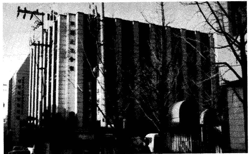
마포구 서교동의 인쇄문화회관 전경. 대한인쇄조합연합회, 대한인쇄문화협회, 대한인쇄연구소가 함께 위치하고 있다.