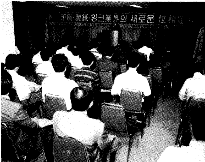
대한인쇄조합연합회는 기술향상을 위한 각종 세미나를 열고 있다.

은해 상공부 승인을 받았고 82년에는 문공부의 인가를 받았으며, 87년 김직승 회장이 7대 회장으로 선출된 이후 지금에 이르고 있다.