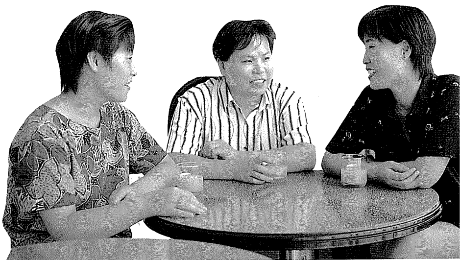
똑같은 웃음소리, 컷트형의 머리모양 등이 닮은 세자매, 그러나 알뜰하고 꼼꼼한 살림꾼씨가 더 많았다

고달팠던 시간들을 가족이라는 이름으로 잊게 해주는 이들. 그속에서 느끼는 사랑. 그들이 꿈꾸는 또하나의 삶이다. (글 김주희) □