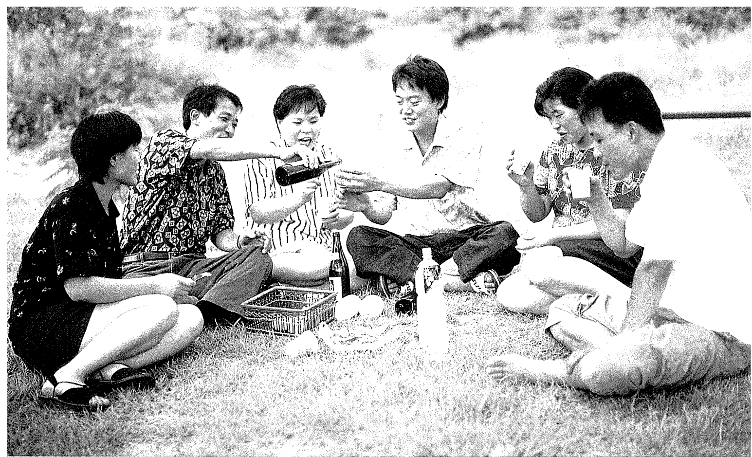
오래간만에 식구들이 한자리에 모였다. 둘째 동서에게 술을 권하는 큰형님의 손길이 따사롭다