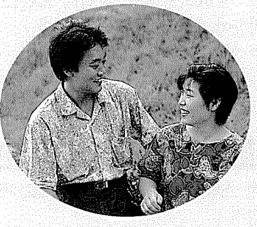
축구, 배구, 달리기... 못하는 운동이 없는 둘째 고집세고 무뎉뎉하기로 소문난 그이지만 아내 사랑은 유별나다.