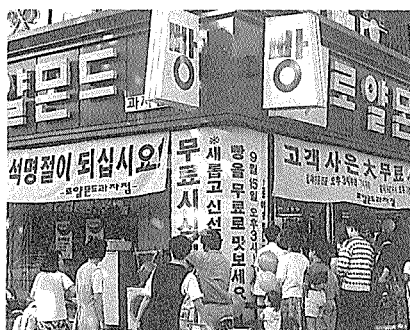
로얄몬드가 지난 9월 15일 무료시식회를 하는 모습. 쿠키와 생크림케이크 등의 제품과 풍선을 무료로 나눠줬다.

그러나 이곳의 매출을 올려주는 이는 40%의 인근에 사는 고정고객이다. 따라서 무료시식회가 지역고객을 위한 잔치가 되어야하는데 그보다 우연히 지나가는 사람들에게 제품이 무료로