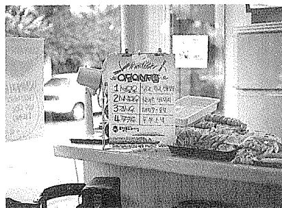
매달 새로 나오는 제품을 안내하는 것도 서비스의 한 방법이다.

그는 봉투 모으기가 매출을 올리는데 한몫을 한다고 자신있게 말했다. 봉투를 모아와서 빵만 얻어가는 것이 아니고 대부분은 그 이상을 사가기 때문이다. 또한 봉투하나가 유대관계를 만들기 때문에 그들과는 영원한 단골로 만날