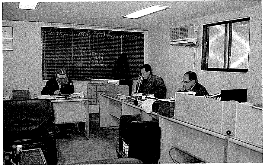
2층에 마련된 사무실

신공장에서는 완벽한 설계도면을 위해 컴퓨터시스템 또한 마련하게 되므로 개발부의 역할이 자못 기대되고 있다.