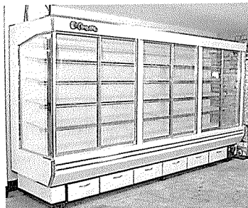
유럽형 전면 쇼케이스