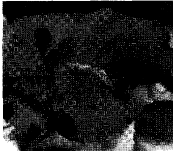
금년에는 고온과 한발때문에 병 발생이 적었다. 사진은 갈색무늬병에 걸린 사과나무잎.

이 병은 병원포자가 발아하고 증식하는데 적당한 온도가 15~20°C로써 분생포자 및 자낭포