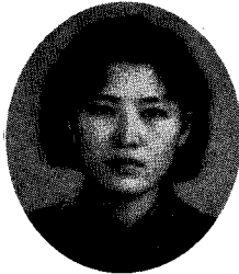
이 선 화