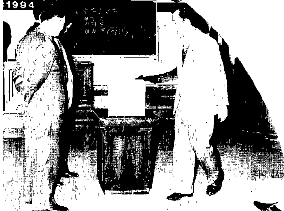
◀ 회장선출 투표모습