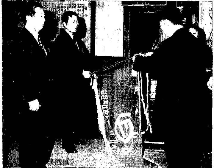
▲ 최우수 지부상을 받은 대구지부