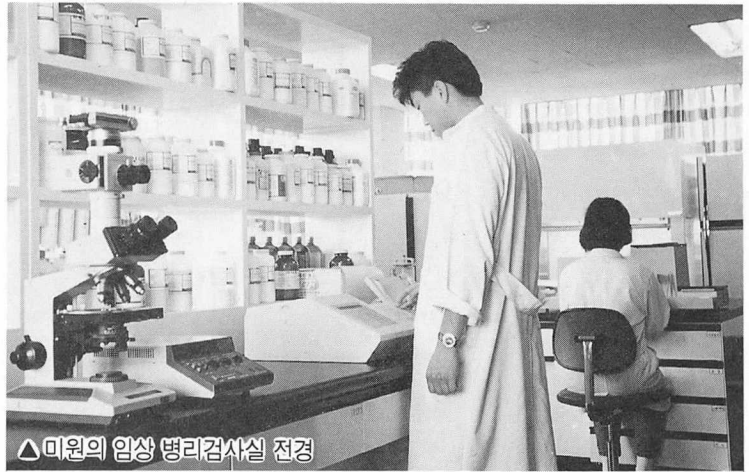
△미원의 임상 병리검사실 전경