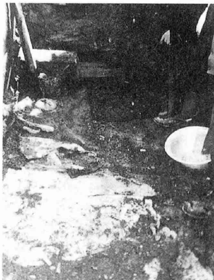
〈사진4〉 소략물을 제거한 후 발굴하기 전의 S마춤사 연탄 아궁이