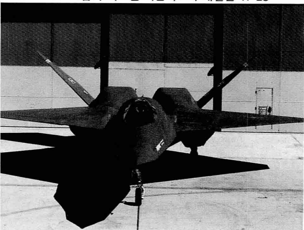
▼노드롭과 맥도넬 더글라스가 개발한 YF-23

레이다 피탐지율과 높은 기동성 및 민첩성, 그리고 후연기 사용없이 초음속 순항능력 보유 및 F-15에 필적하는 무장적재 능력을 갖추었다.