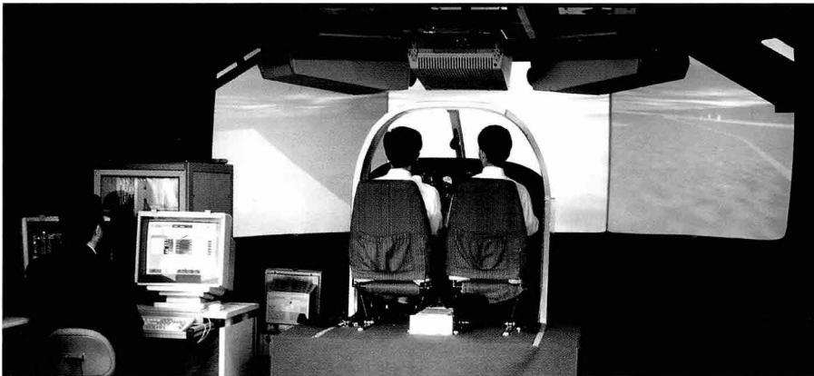
◀ 대한항공이 국내 최초로 개발한 실시간 영상시현 시뮬레이터 「Sky View 1」

공군 전투발전단과 대한항공이 공동 주관한 제2회 모의훈련장치(시뮬레이터) 세미나와 전시회가 11월 4일 충남 계룡대내 기지극장에서 열렸다.