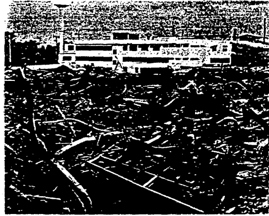
1, 2, 3공장은 완전 붕괴되었다.