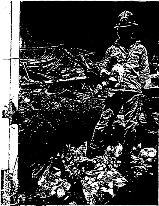
한 중업원이 잿더미 속에서 인형을 찾아내고 있다.