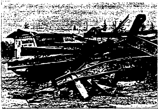
철골 콘크리트 슬라브 건물이었으나 내화피복이 되어 있지 않았다.

火災警報設備는 設置되어 있었지만 스프링클러는 設置되어 있지 않았었다. 不幸하게도 1工場에서 設置된 警報設備가 作動되지 않아 避難이 遲延된 것이다. 警報設備가 정상적으로 作動한 1工場과 2工場에서는 人命被害가 없었다.