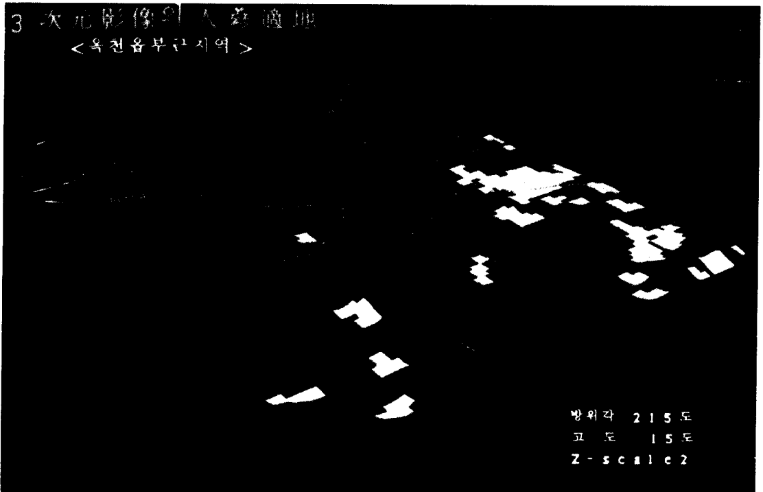
Fig. 1 Ginseng cultivation suit-land of Ocheon area

은 내륙지방에서는 한정된 토지를 효율적으로 이용할 수 있어야 한다는 점이 구체적이고 실제적 정보의 가치를 가지고 있어야 대농민에 대한 행정서비스 차원에서도 바람직한 행정이다.