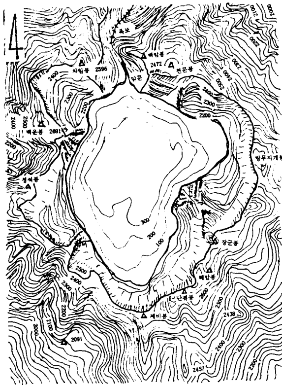
Fig. 1. The map of Chonji and Peaks of circumference

본 연구는 白頭山에 분포하는 資源植物을 조사 하므로서 後學들에게 백두산식물에 대한 이해를 돕고 통일시 北方植物을 利用하는데 도움을 주고자 調查하였던바 그 內容을 간추려 報告하고 상세한 것은 「原色 白頭山 資源植物圖鑑」(아카데미출판사)을 參考하기 바란다.