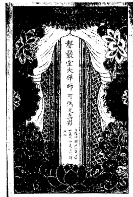
〈圖 1〉 楓巖堂 可僞 眞影 (김룡사 소장)

眞影이란 말은 보통 肖像畫 또는 佛書라고 해석되는 것으로 인물의 본질을 의미하는 眞과 겉모습을 본 뜬 影이 합해서 된 것 2) 이다. 그러므로 이러한 조사도는 사실적이다. 초상화이므로 생존 시에 그 모습을 그려 놓지 못한 경우는 상상에 의해 진영을 조성하지 않고 명호를 쓴 위패로 대신하였던 것에서 알 수 있다. <圖 1>의 김룡사의 농암 가위 진영은 진영 대신 이름을 쓴 위패와 자신의 계승으로 대신하였다. 즉 “○○大禪師 ○○之眞影”이라고 쓴 것을 초상화 대신하여 모신 것이다.