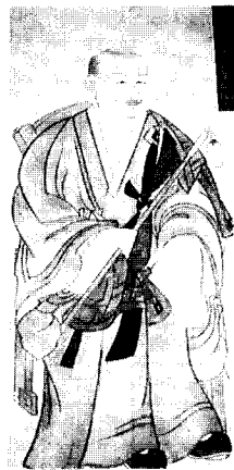
〈圖 6〉검정색 조표현 (기봉당대화상)