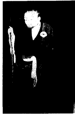
〈圖 2〉 빗장장식 (1세 보조국사)