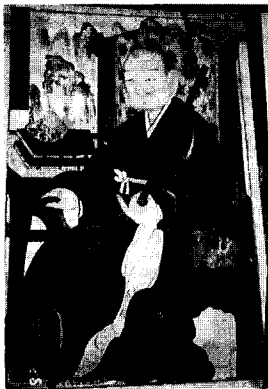
〈圖 5〉조표현(바늘땀) (육암당대화상)

長衫의 색으로는 연회색·회색·진회색·연고동색·고동색·진초록색·군청색·곤색·진밤색(현재의 조계종 가사색) 등이 사용되었으며, 물론 조사도의 수도 많긴 하지만 장삼의 색이 다양하게 여러가지 색으로 사용된 것을 볼 수 있으며, 장삼의 문양도 함호당선사(圖 9)의 경우만 있고 나머지는 모두 문양이 없다. 동도사의 조사도에서도 그렇고 장삼의 색은 비교적 다양한 색들이 사용되었다. 이는 가사의 경우는 인도의 것을 받아들여