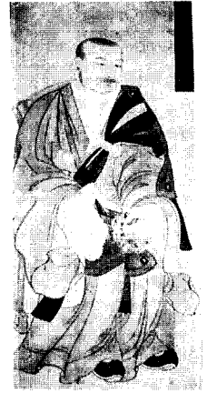
〈圖 8〉장식적 영자 (보광당대화상)