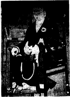
〈圖 4〉첩상가사 (응봉화상)