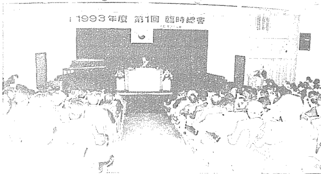
임시총회 속개회의 광경

지난 3월 17일 '93전국 건축사 대회를 앞두고 개최되었던 본 협회 93년도 제1회 임시총회가 현재 건설부가 추진하고 있는 건축사법 개정시안에 대다수 회원의 의견과 상충되는 불합리한 부분이 있다고 판단, 이를 개악으로 규정하고 건설부로부터 개선헌하겠다는 내용의 납득할 만한 결과를 가지고 속개회의를 개최한다는 조건부로 휴회된 바, 지난 4월 9일(금) 오후 2시 총대의원 422명중 381명이 참석한 가운데 본협 대강당에서 속개회의로 개최되었다.