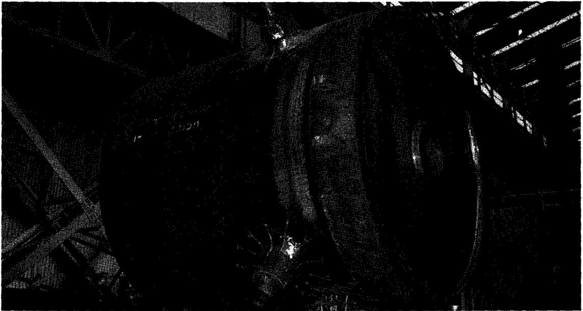
〈그림 2〉 울진원자력 3호기 Steam Generator 하부용기에 급수 Nozzle 동점작업

3. 월성 2, 3, 4호기는 국내 최초로 중수로 기자재를 국산화한다는 목표하에서 추진중이며, 국내 처음으로 CSA(Canadian Standards Association) 코드를 적용하므로 다소 어려움은 있으나 그간 축적된 기술을 근간으로 제작기술 자립에 역점을 두고 추진할 계획이고, 중수로 핵심기기인 Calandria를 월성 4호기에서 한중이 국내 처음으로 국산화함에 따라 제작기술 보유회사와 기술이전계약을 체결하여 기술자립기반을 구축해 나갈 것이다.