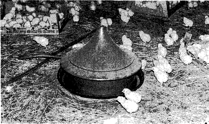
▲벧짚은 보온성이 뛰어나 어린병아리의 깔짚으로 적당하다.

장의 흐름에만 의존하다 보면 가격이 떨어지는 때에 자칫 사양관리에 소홀하게 되어 피해가 더욱 심해질 수 있음을 사양가들은 인지해야 할 것이다.