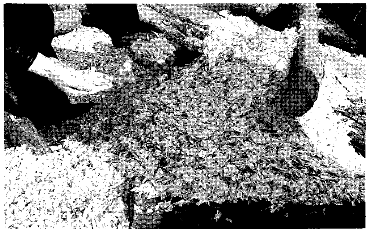
▲목재칩은 뛰어난 흡습력과 먼지발생이 적은 반면 일반농가에서 구하기가 어려운 단점이 있다.

육성 전 기간을 통하여 사용되는 깔짚은 계군의 최종 수익에 큰 영향을 미치므로 깔짚의 재료, 양, 질 등을 고려하여 세심한 관리가 필요한데 우리나라의 경우 깔짚의 연구와 중요성 인식이 부족하