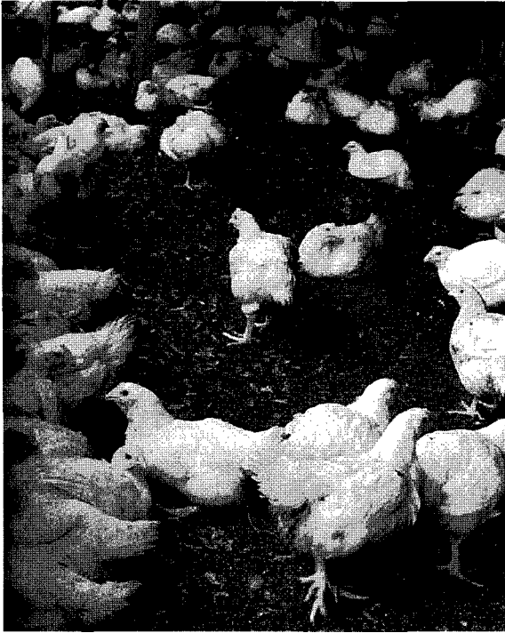
▲왕겨를 이용한 발효계사 내부모습(성적이 좋고 나쁘 다는 이견이 있어 이에 대한 연구가 시급한 편이다.)