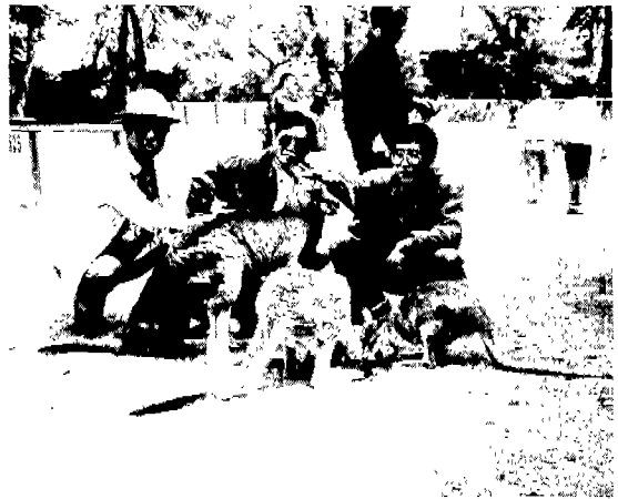
▲ 호주 야생동물원에서 (우측 : 필자)

킹스크로스에서 특이한 것은 전철역 등이나 공공장소에 공중화장실이 없다는 것이다. 그 이유는 마약 중독자들이 이곳에서 마약주사를 맞기 때문인데 그 예방으로 공중화장실을 없앴다고 한다. 밤의 환락 도시인 킹스크로스도 밝은 아침에는 도로에 출근차량으로 차량이 길게 늘어서서 밤의 풍경과는 대조를 이룬다.