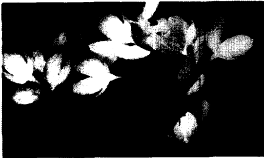
애기고광나무의 꽃과 화서.