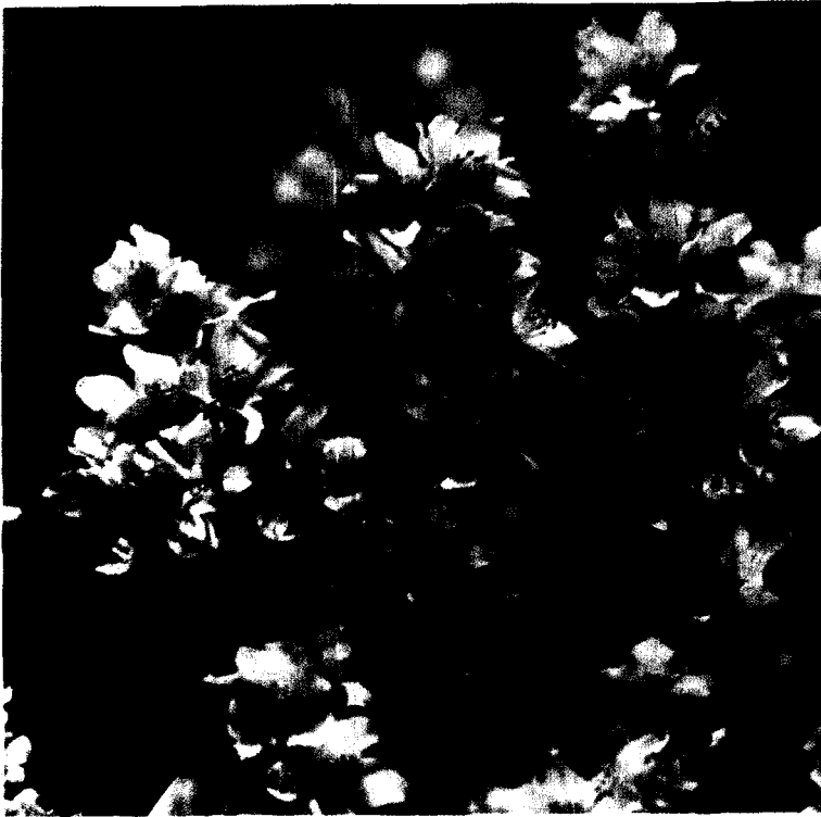
섬고광나무의 꽃과 화서.