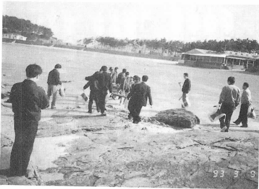
3월9일 채석장 주변에 파도에 밀려온 철재를 회원들이 수거하고 있다.

한편 3월20일에는 부안군청의 주관으로 지부회원 123명, 일반인 38명, 군인 150명, 학생 150명 등 총 461명이 참가하여 변산반도 국립공원전역을 대상으로 해상오물수거, 모래사장 청소, 쓰레기 소각등 탐방객을 위하여 봉사활동을 전개했다.