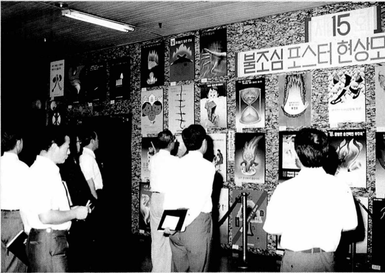
◀ 포스터 심사 장면

협회는 범국민적인 불조심 생활화를 위한 제 15회 불조심 표어·포스터 현상 모집을 실시하고 지난 9월 15일 입선작에 대한 시상식을 가졌다.