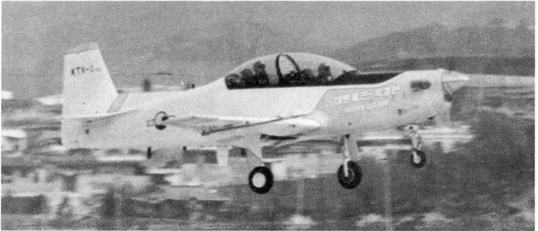
國科研과 대우중공업등 국내 4개社가 공동개발한 군용 훈련 / 지원기는 기술능력 구축의 轉機가 되었습니다

예를들면 1단계로 1995년까지 KFP, HX, KTX Project 등 국가정책사업의 성공적인 수행을 위해 고도의 제작기술을 확보하고 경쟁력 강화를 통해 부품생산을 확대하며, 경항공기, 초등훈련기를 독자개발합니다.