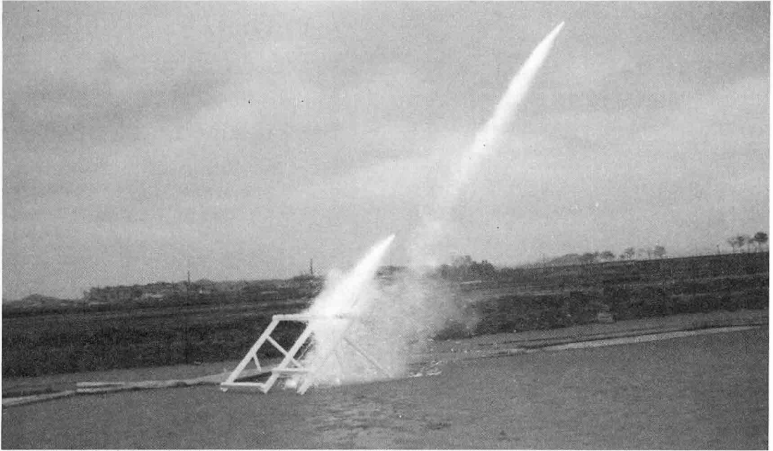
적에게 막강한 위력을 발휘했을 것으로 보이는 신기전의 발사 시험 모습