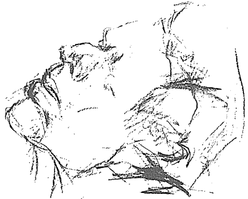
▲ 쇼팽 기념관 안의 박물관에 있는 쇼팽 흉상

그러나 1945년 1월 나찌로부터 해방된 이듬 해부터, 시민들의 기억과 흔적에 의한