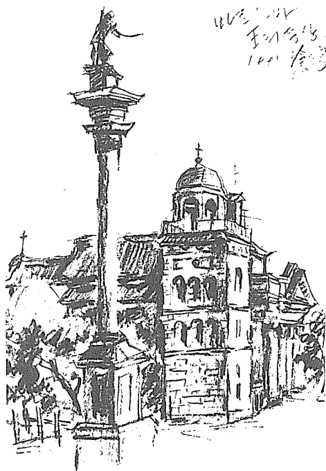
▲ 구 시가 광장에 자리 잡고 있는 왕의 동상. 검을 들고 있는 왕의 모습은 폴란드를 보호한다는 의미를 가지고 있다.

그렇게 혼란스러웠던 조국 폴란드를 떠나 프랑스에 머무를 수 밖에 없었던 음악가 쇼팽은, “내 몸은 죽어 프랑스에 있지만 내 영혼은 언제나 폴란드에 있다”라는 유언을 남겼다. 이 말은 어려웠던 시절의 폴란드인들에게 자긍심과 희망을 불어 넣어 주었고 지금까지도 그들은 쇼팽을 자랑스럽게 생각한다.