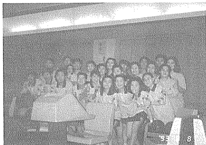
한국건강관리협회 본부 및 서울지