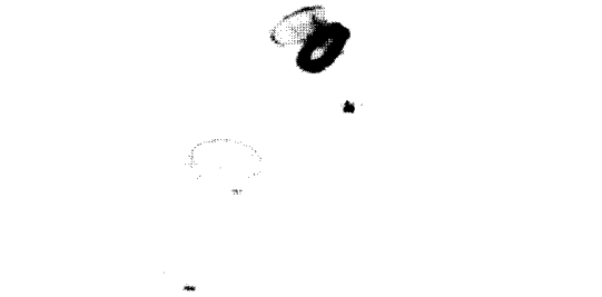
Fig. 2A. The aspirate of the cyst of Fig. 1B reveals some eggs of C. sinensis (wet smear, \times 400 ).