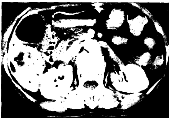
Fig. 1C. A multiseptated enhancing mass-like lesion suggesting abscess (arrow heads).

소와 적혈구 용적은 12.3g/dL 및 36.3%이었고, 혈소판수는 219,000/mm 3 이었으며 BT, PT, BTT는 2분, 11초, 31초로 정상범위였고 간기능검사상 SGOT는 136 U/L, GPT는 83 U/L, alkaline phosphatase는 233 U/L, bilirubin은 3.6 mg/dl로 증가된 양상을 보였으며 그 외 단백, 알부민 등의 검사결과는 정상범위였고 전해질도 Na, K, Ci가 각각 139.6 mEq/L, 4.17 mEq/L, 97 mEq/L로 정상범위였다. 소변검사는 정상소견이었고 대변 검사상 충란이 관찰되지 않았으나, 간흡충증에 대한 피부검사에서 80mm 3 의 경결을 보여 양성 반응이었다. 천자후 시행한 아메바 항체는 1:100으로 양성으로 나타났다.