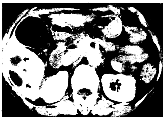
Fig. 1B. The lower section of the CT scan (the same scan of Fig. 1A) shows variable sized cysts (arrows).