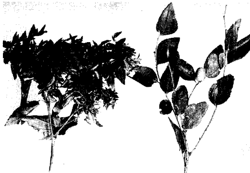
Fig. 1. Remission of witches'-broom symptom in diseased jujube tree after oxytetracycline-HCl (OTC) injection.

+ : more severe symptom than previous year.