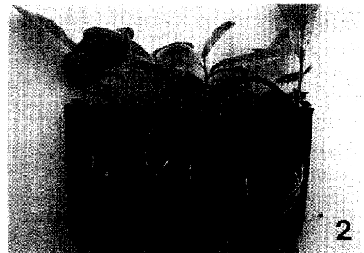
Fig. 1. Acclimatization of microshoots of Quercus acutissima using the peat plug systems under intermittent misting and partially shaded growth chamber.