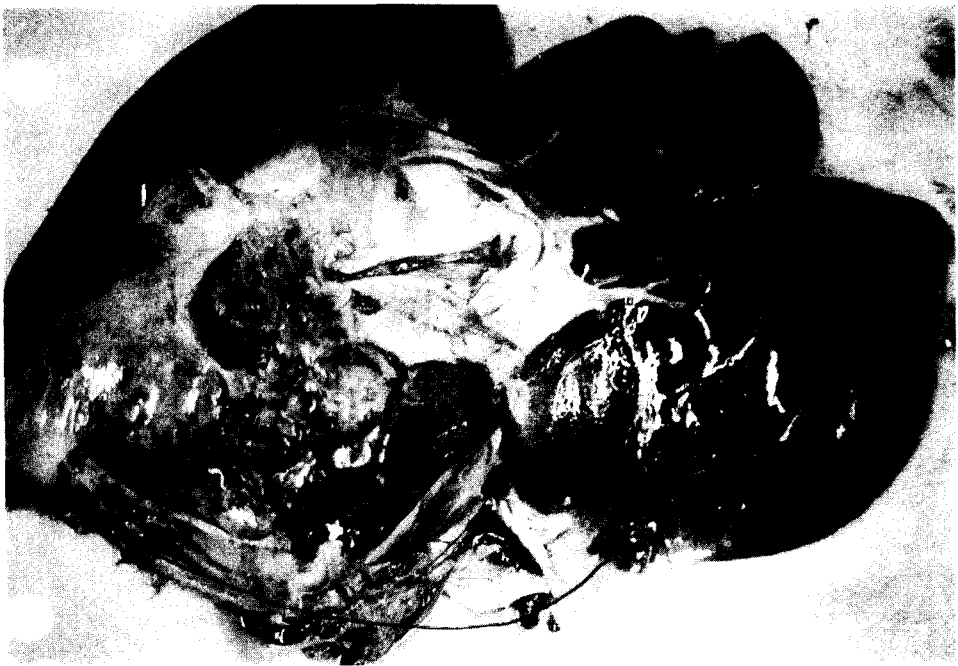
Fig. 1. Abscess of liver.