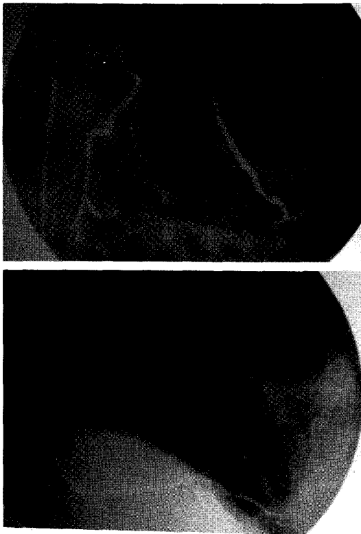
Fig. 2. Angiographic finding of patient No. 3. No abnormality of both coronary artery was observed in this patient.

함해 보면 구미에서는 1~2%의 빈도로 6,7,13) 그리고 국내에서는 11~13.4%까지 다양하게 보고되고 있다 11,12) . 국내에서 구미각국보다 더 높은 빈도로 보고되고 있다. 박 등은 12) 그이유를 우리나라나 일본에서 서구보다 변이형 협심증의 빈도가 더 많은 것과 관련이 있을 것으로 추측하였다 12) . 그리고 정상 관동맥 소견을 보이는 급성 심근경색 환자의 임상적인 특징을 종합하면 비정상소견을 보이는 환자보다 더 젊은 연령에서 발생하며 특별한 위험인자를 갖지 않는 경우가 많으나 5~7) 일부의 보고에서 위험인자중 흡연이 혈전발생인자로서 중요한 역할을 한다는 보고가 있다 14) . 예후는 비정상 소견을 보이는 급성 심근경색증 환자보다 좋은 것으로 알려져 있다 5~8) . 또한 약물에 의해 발생하는 경우와 임신이나 출산후 발생한 경우, 그리고 젊은환자에서 운동후 발생된 급성 심근경색에서도 정상 관동맥 소견을 보인다는 보고가 있었다 15~17) . 저자 등의 연구에서 정상관동맥의 소견을 보이는 경우는 급성 심근경색후 관동맥촬영을 시행하였던 환자중 64명 중에서 7명으로 그 빈도는 10.9%였다. 이는 국내의 다른 보고자들의 결과인 박등의 11) 12%, 박 등 12) 의 13.4%와 비슷한 결과를 보이며 남녀비는 6:1로 대부분(83.4%)의 환자가 남자였다. 또한 평균연령이 31.1 \pm 3.9 세로 같은 기간의 정상관동맥소견을 보이지 않았던 심근경색 환자 57명의 평균연령인 57.7 \pm 10.9 세