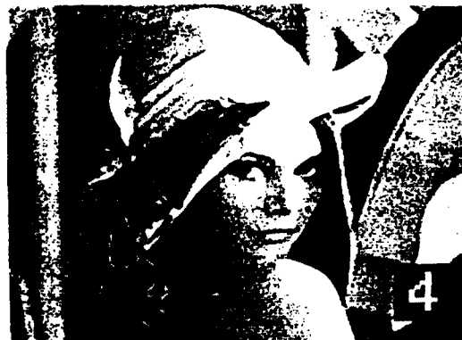
그림 4. 코사인 값을 직접 곱한 방식에 의해 재생된 영상 Fig 4. Reconstructed Image by the cosine multiplication

상을 처리하는데 소요되는 실행시간의 비는 i80386 PC에서 약 1:7.3이었다(coprocessor를 사용하여 코사인 곱셈의 속도를 향상 시킨 경우도 약 1:1.2). 이는 제안 알고리즘이 처리속도의 향상에 유용함을 보여 주는 것이다.