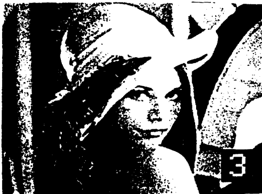
그림 3. 제안 방식에 의해 재생된 영상 Fig 3. Reconstructed Image by the proposed approach