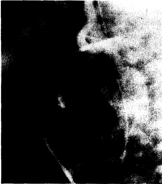
그림 3. 술전 심혈관 조영술. 관상동맥이 발육부전인 상행대동맥에서 기시하는 모습과 대동맥 교약증(COA)을 보여줌.