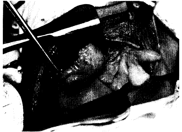
그림 3. 절제되기 전 모습