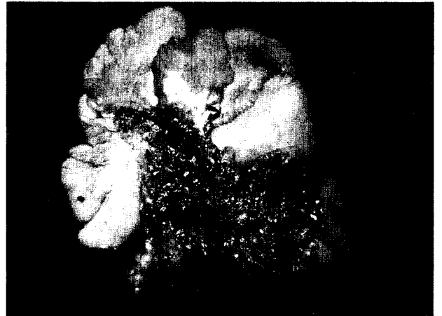
그림 4. 절제된 후 모습

원한 지방종은 흉막 내측이나 외측으로 자라며 그 위치와 성장 속도가 느리기때문에 대부분의 경우에서 무증상인 경우가 많아 진단이 늦어진다. 1962년 Koernchild 등은 4.1 Kg의 흉막 지방종을 제거하여 보고한적도 있었다 2) . 증상으로는 흉막 자극, 마른기침, 흉부압박감, 배통과 운동성 호흡곤란 등이 있다. 진단은 정기 흉부 엑스레이에서 우연히 발견되는 경우가 흔하며 흉부 단층촬영상 늑막종괴의 특징을 보이며 종괴의 음영이 균등하고 -50에서 -150의 CT number를 갖는 지방음영이며 다른 지방 병소를 제외할 수 있으면 흉막 지방종의 범주에 든다고 할 수 있다 3) . 흉막외 지방종인 경우 경피적 침생검이 진단에 도움이 되기도 하나 다른 종양이나 악성 종양을 배제하기