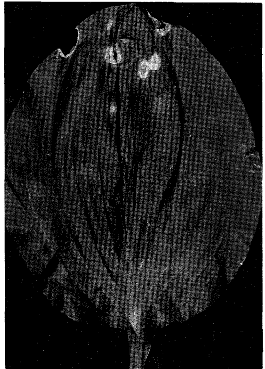
Fig. 2. Late lesions of leaf spots.