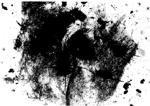
Fig. 4. Pycnidia formed on lesions of diseased plant (X50).

산마늘에 반점병을 일으키는 본 병원균은 강모의 형성양상과 Allium 속식물에 병원성을 가지고 있다는 점으로는 Vermicularia sp.와 비슷하나 병포자의 형태가 전혀 다르고, 같은 Allium 속 식물인 파, 부추, 양파에서도 병원성을 가지고 있지 않아 Vermicularia sp.는 아니라고 생각되며, 병자각의 생성양상과 병포자의 형태는 오히려 Aristastoma sp.와 비슷하였기에 본 병원균은 Aristastoma