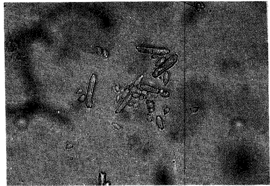
Fig. 5. Pycnidiospore formed in pycnidium (X200).