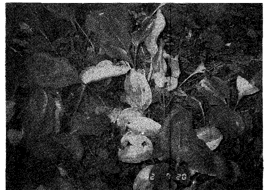
Fig. 3. Withering of diseased plant.