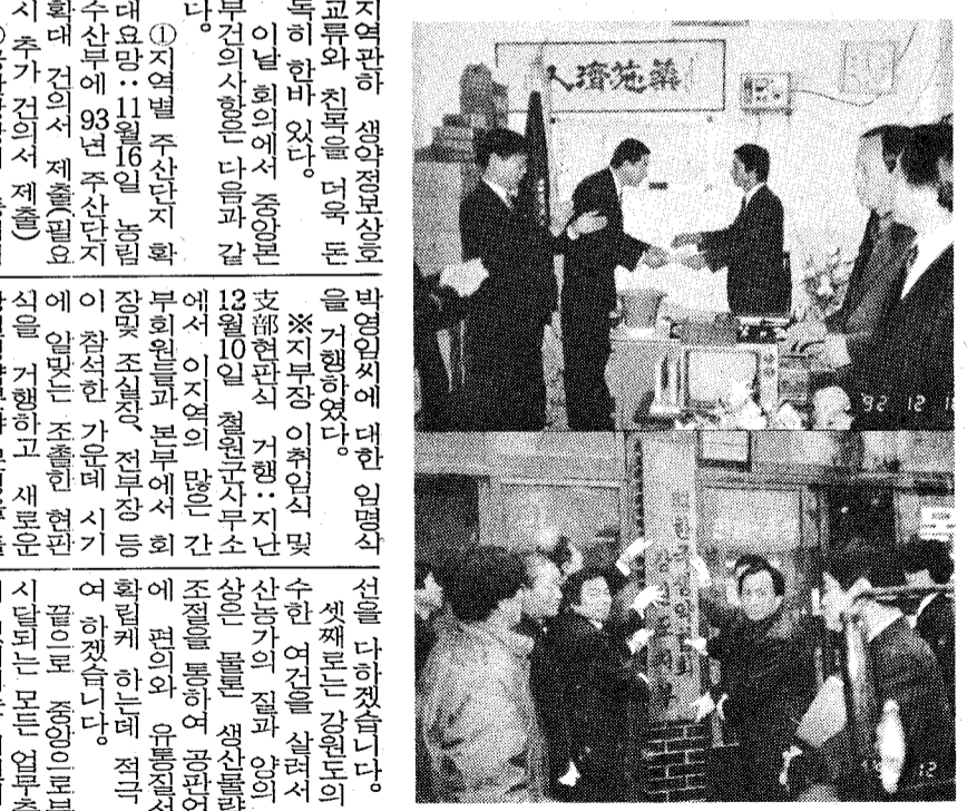
◇강원도지부장 이취임식및 지부현판식 거행.