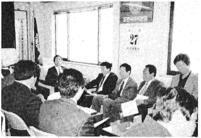
◇92년도 시·도지부장 제2차회의

①회비의 징수 방법: 현재까지 시행해온 分期別 徵收方法을 폐지하고 每月末 현재로 支部기판에서 納付후 支會회(會費) 또는 本會소장(회비)에서 徵收하는 方法을 채택할 예정이다. ②生産費 行政지도 계속 強化 施行: 昨年 8월 1日付 시행한바 있는