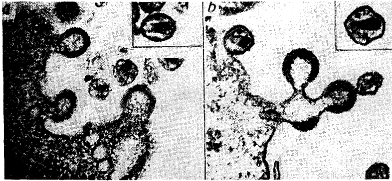
그림 1. BIV 감염牛肺細胞 (a) 및 HIV 감염 H9 lymph 球 (b)의 超薄切片의 透視電子顯微鏡寫眞. 모두 出芽粒자를 보여주고 細胞내에는 전형적인 성숙 BIV 및 HIV 입자를 보여주고 있음(Gonda 등, 1987에서).

age (大食細胞)일 것으로 생각된다는 것이다. BIV를 실험적으로 감염시켰을 경우 소 이외에 양, 산양에도 감염하나 virus는 회수되지 못하였다고 한다. 토끼에서는 감염이 성립되며 virus와 항체가 모두 검출된다고 한다.