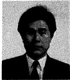
글/김영호 <(주)정우하이텍 대표이사>