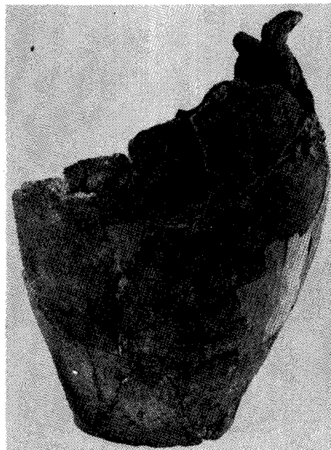
圖面1. 釜山 槐亭洞貝塚出土 丹塗磨研土器(축적 1/3) (1 : 새로 복원한 것, 2 : 이미 보고된 것)