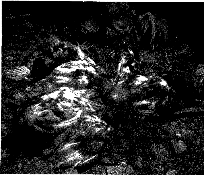
전염성 F낭병(IBD)에 걸린 닭들